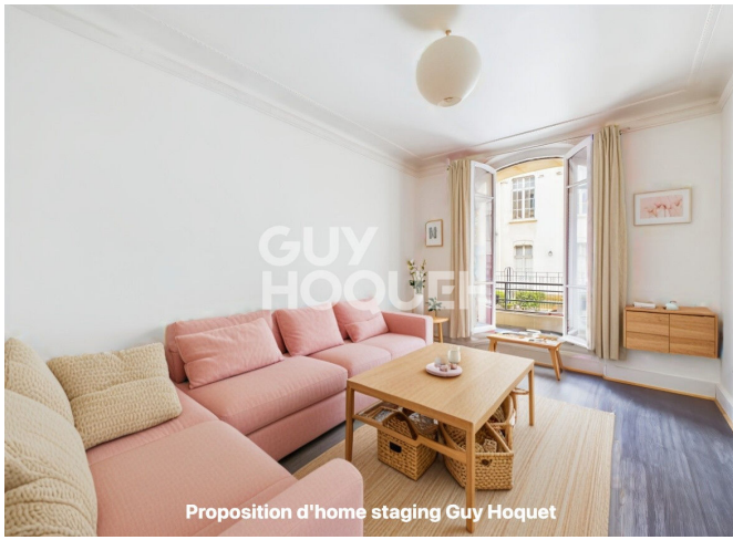
Proposition d'home staging Guy Hoquet