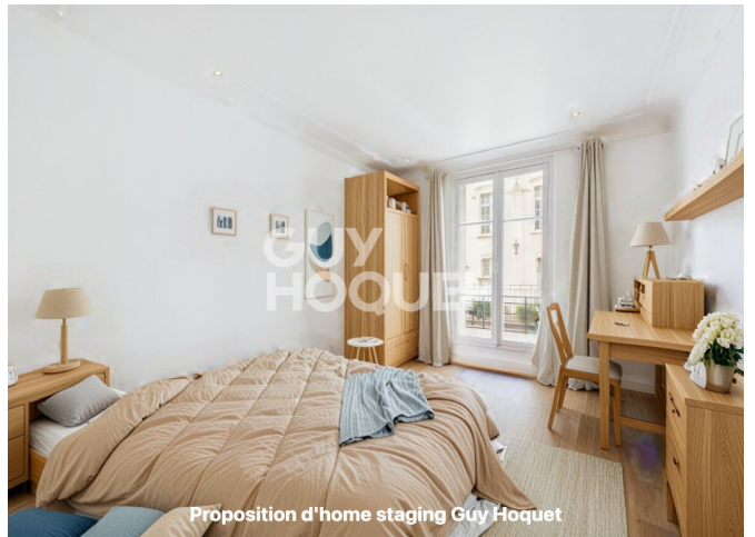
Proposition d'home staging Guy Hoquet