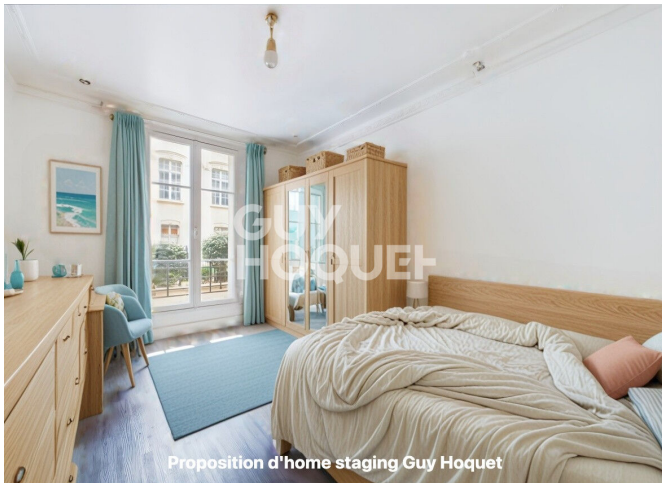
Proposition d'home staging Guy Hoquet