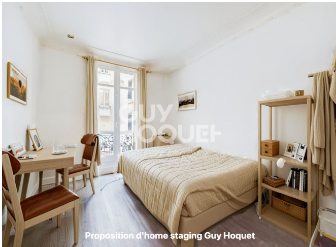
Proposition d'home staging Guy Hoquet