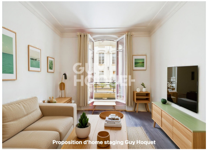
Proposition d'home staging Guy Hoquet