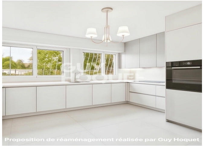
Proposition de réaménagement réalisée par Guy Hoquet