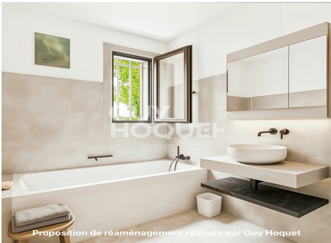
Proposition de réaménagement réalisée par Guy Hoquet