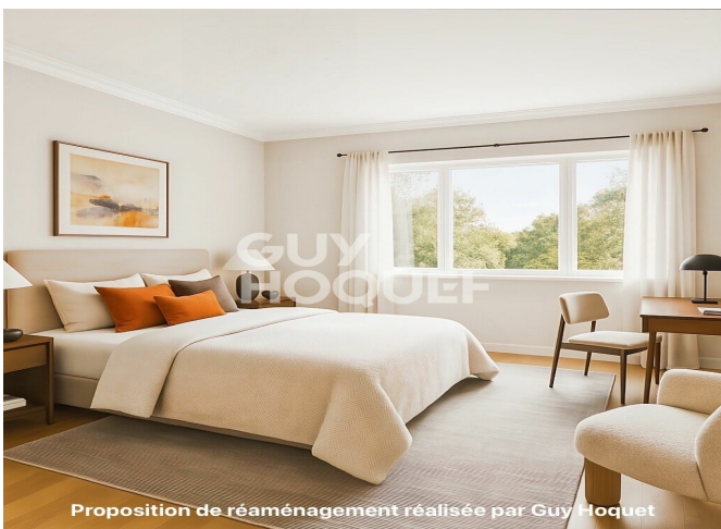
Proposition de réaménagement réalisée par Guy Hoquet