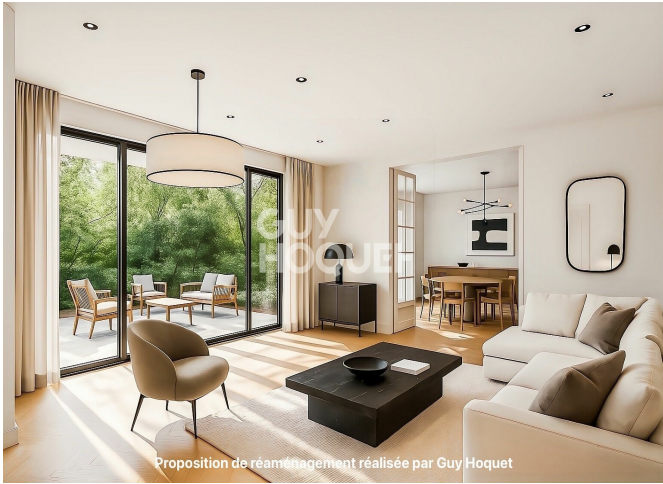
Proposition de réaménagement réalisée par Guy Hoquet